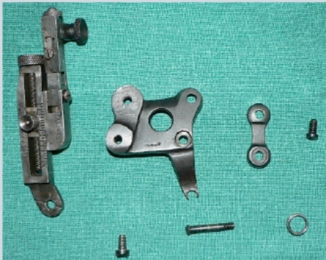
En position couché ou de rangement

Un dioptre MUES complet avec toutes ces pièces de fixation