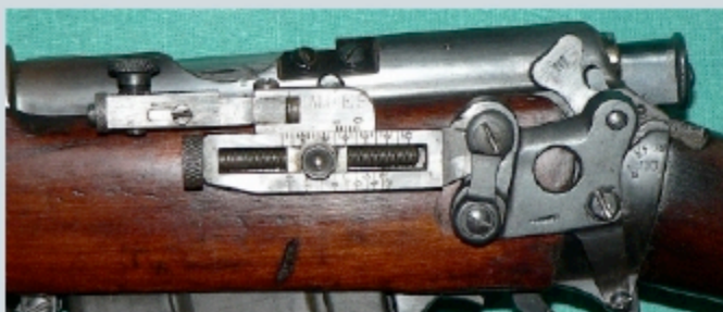
En position de tir