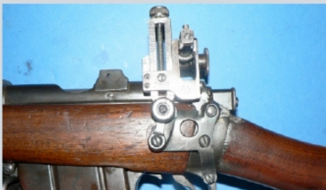
Un Alfred J Parker pour Lee Enfield N°1 MKIII et N°1 MK3* ou Lee enfield MK1 en situation