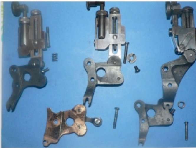
Vue latérale des dioptrés