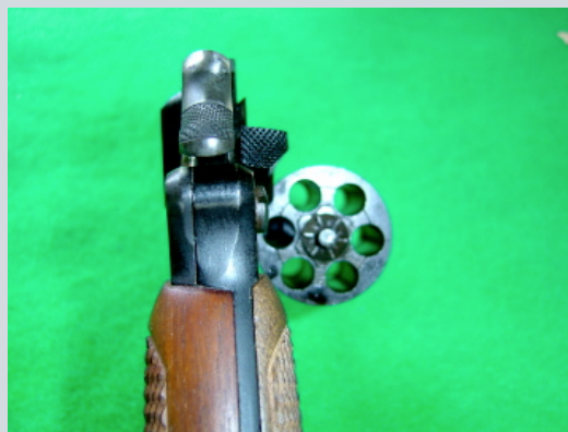
Le côté droit du canon comporte l'année de fabrication de l'arme précédée de la lettre S représentant la MAS