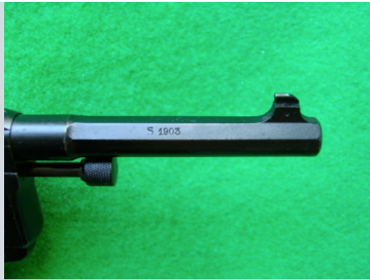
Poçons de contrôle