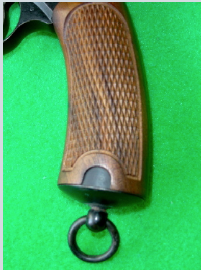
Détail de l'anneau