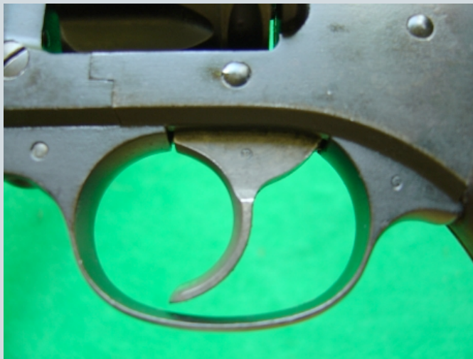
L'intérieur du canon